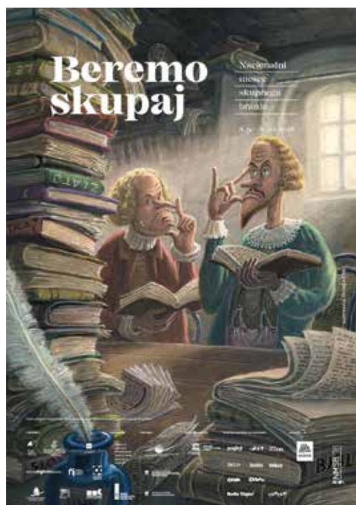
Plakat akcije Beremo skupaj, ilustracija: Zvonko Čoh, ambasador NMSB 2018